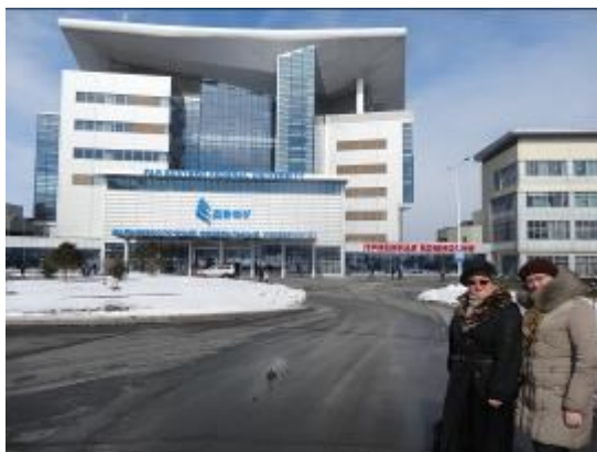
На фото: Здания университета