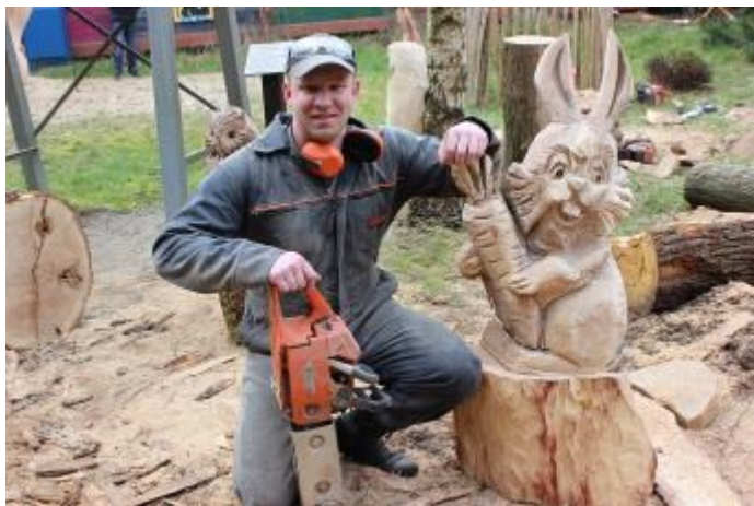
На фото: Блиц-турнир