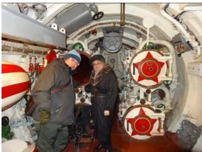
На фото: На подводной лодке