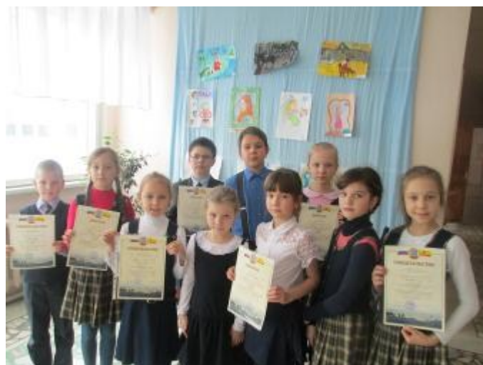
На фото: Участники НПК «Я—исследователь»