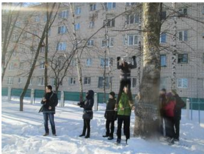
На фото: Главные помощники—учащиеся 11А

Второй этап «Малой зарницы» проходил на улице. Всего было 11 станций: «Разведение костра»; «Параллельная переправа»; «Лабиринт»; «Медицинская помощь»; «Лазутчики»; «Бросание лёгости»; «Метание гранаты с положения лёжа»; «Сбор палатки»; «Спринт»; Стрельба; «Быстрый, ловкий, прыгучий».