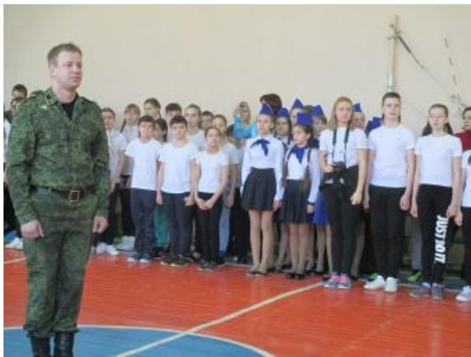
На фото: «Юнармейцы! Смирно!»